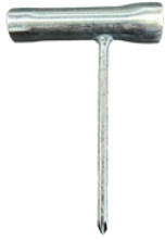
LLAVE TIPO T