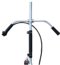
MANUBRIO TIPO "U"